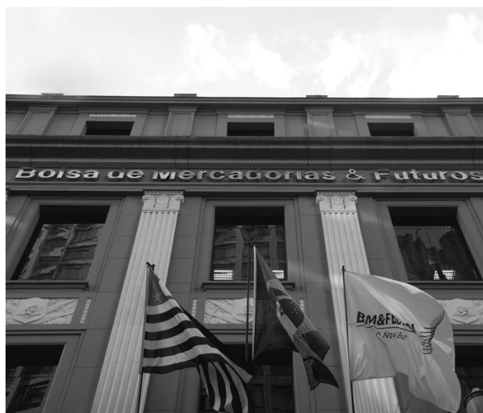
Fachada da Bovespa, R. XV de Novembro, junho de 2008.